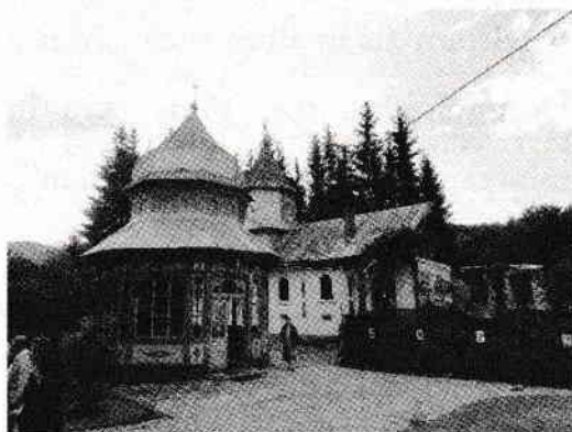
Paraclisul Sfinților Părinți Ioachim și Ana.