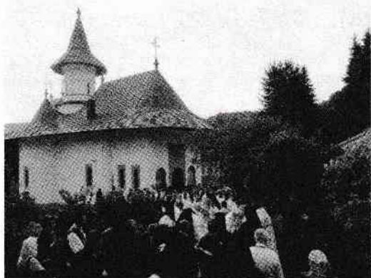
Biserica Nașterea Maicii Domnului.