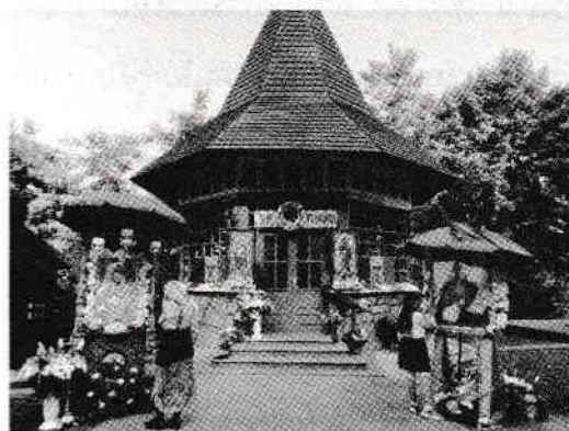
Altarul de vară de la Sihla împodobit de Hramul Sfintei Teodora.